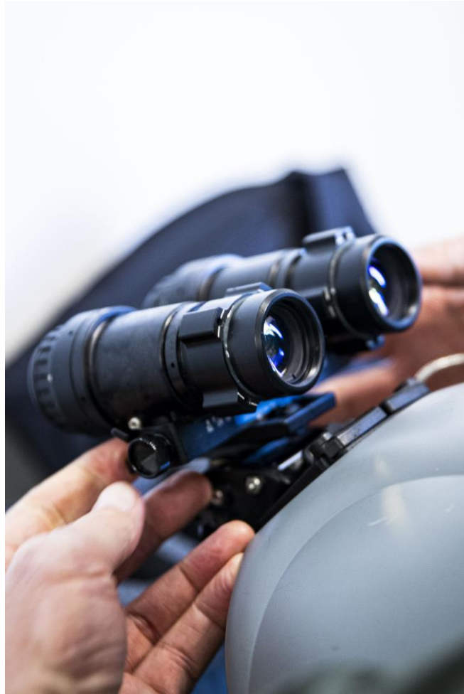
Night Vision Goggles worden gemonteerd op de helm van de vlieger

het in de meeste gebieden aardedonker. Een NVG is dan een waardevol instrument dat onder andere helpt tijdens het navigeren.